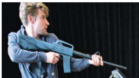
'De Hollanders' > lees meer op pagina 4

Ontstaan in januari 2001 uit een fusie tussen de Amsterdamse Toneelschool (opgericht in 1874) en de Akademie voor Kleinkunst (opgericht in 1960)