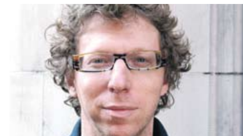
Column Arnon Grunberg > lees meer op pagina 2