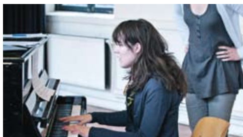
'Crimes of the Heart' > lees meer op pagina 6