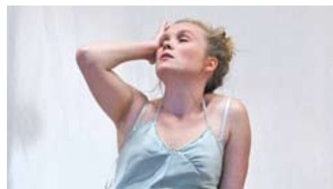
'Iedereen behalve ik' > lees meer op pagina 8